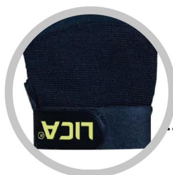
MUÑECA CON FELPA Y GANCHO